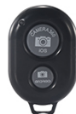
Bluetooth селфи дистанционно управление