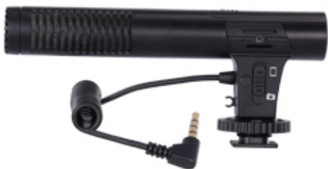
Насочен кондензаторен микрофон с филтър от пяна