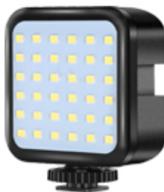
LED Видео осветление с 3 нива на яркост на светене