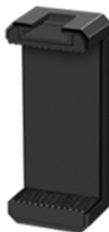
Стойка за смартфон